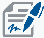
Contrat d'assurance vie exonéré